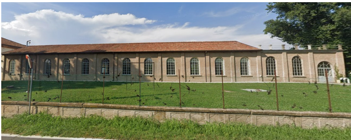
Esempio 1: Recupero di fabbricato industriale

8. gli edifici di nuova costruzione o sottoposti a ristrutturazione totale (demolizione e ricostruzione) a destinazione diversa dalla residenza situati in aree tutelate ex L. 42/2004 art. 142 comma c) o realizzati su lotti a confini con aree agricole nello stato di fatto dovranno essere realizzati avendo cura di provvedere a realizzare rivestimenti esterni con richiami alla tradizione locale come ad esempio a titolo esplicativo ma non esaustivo facciate in mattoni a vista/intonacate con inserti di modanature fasce marcapiano o lesene con materiali con effetto simile e copertura a falde o shed in coppi, tegole o legno o materiali con medesimo effetto estetico.