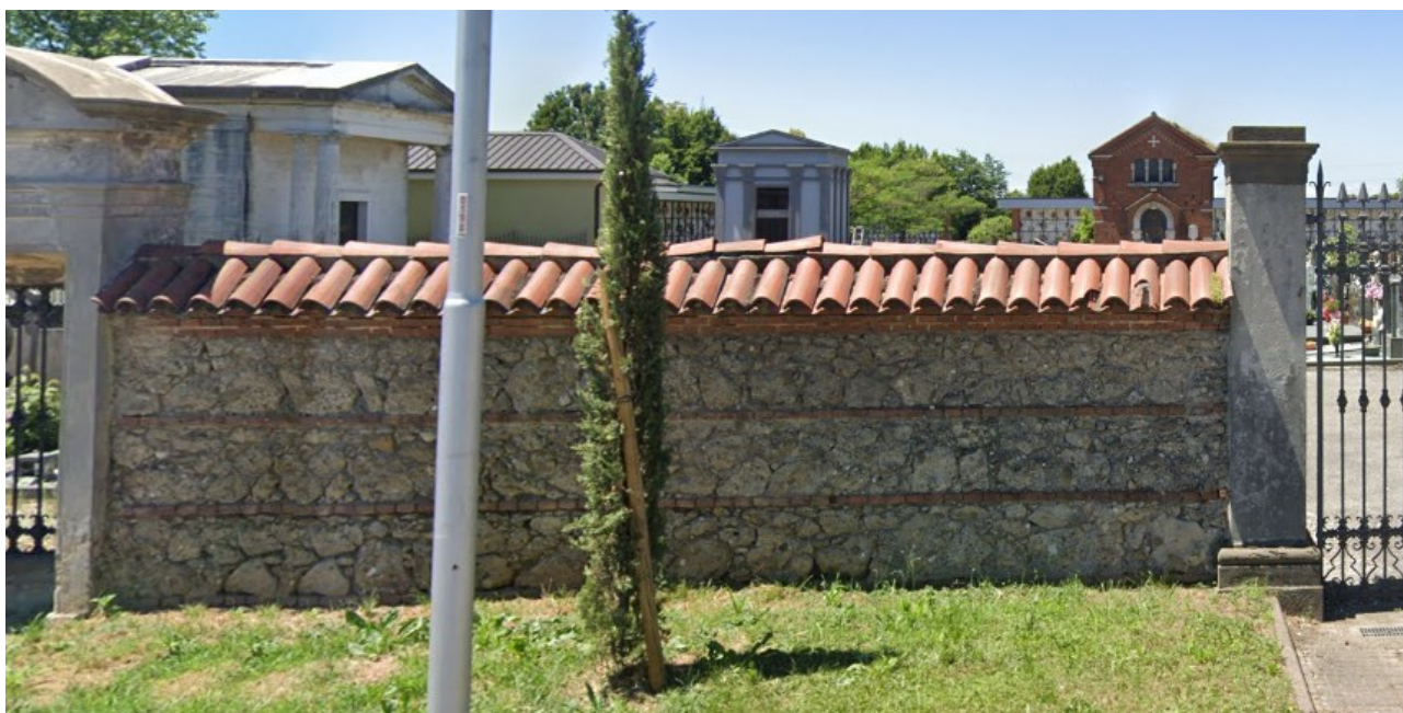
Esempio 5: muratura grezza in materiale lapideo o mattone a vista, copertina con tegole in coppi a canale in laterizio