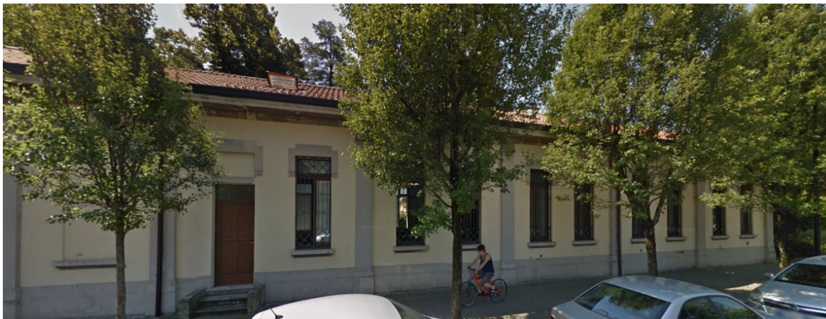
Esempio 2: Recupero di fabbricato industriale