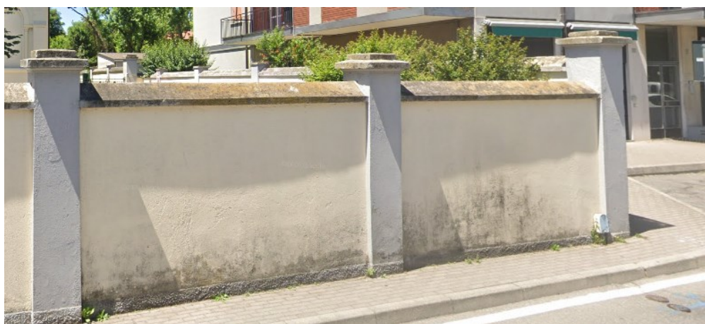
Esempio 2: muratura intonacata tinteggiata piena con pilastrini decorativi e copertine cementizie sagomate decorative