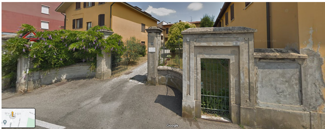
Esempio 4: recinzione con pilastri e portali di ingresso in muratura e recinzione con cordolo di base con muratura intonacata tinteggiata piena con pilastri decorativi e copertine cementizie sagomate decorative; recinzione con cancellata metallica