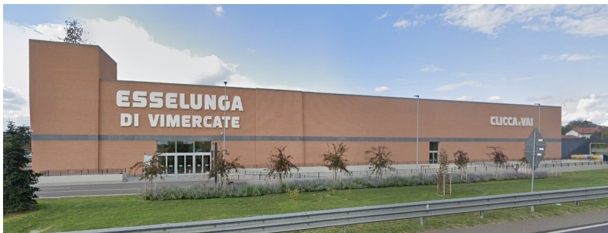
Esempio 3: Nuova costruzione fabbricato commerciale con materiali di facciata di pregio