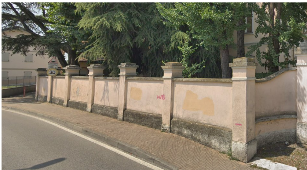
Esempio 1: muratura intonacata tinteggiata piena con pilastrini decorativi e copertine cementizie sagomate decorative e zoccolatura in intonaco strollato